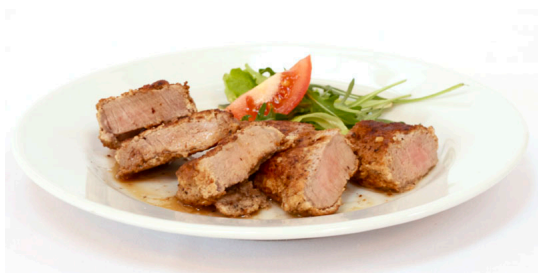
120g Bravčová panenka v orechovom cestíčku pork tenderloin in walnut batter schweinerückensteak mit walnuss € 4,20