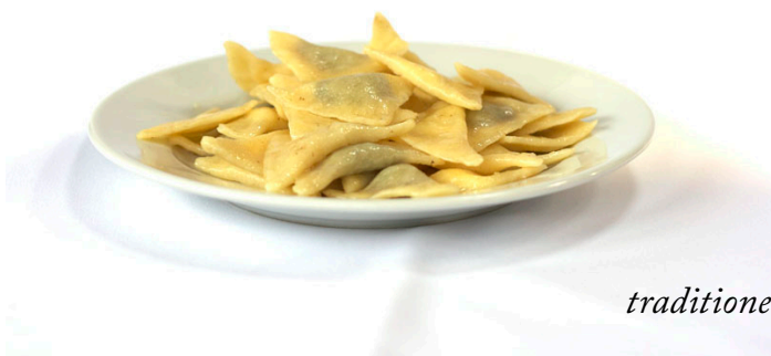
300g Domáce pirohy traditonal home made filled pasta traditionelle hausgemachte gefüllte teigtaschen € 3,30