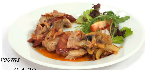
120g Pikantné horárske medajlónky (panenka s klobásou, slaninou, šampiňonami) spicy pork tenderloin sauté with sausage, bacon and mushrooms schweinerückensteak paniert mit wurst, speck und champignons € 4,30